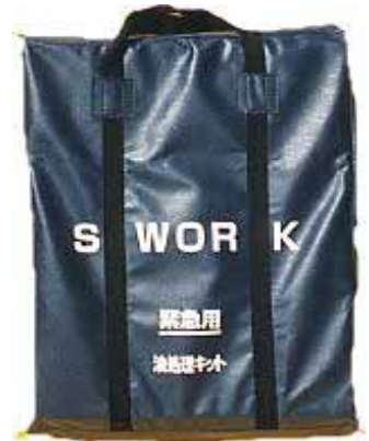
SWORK携帯バッグは不織布で作られています 約40×50×17cm