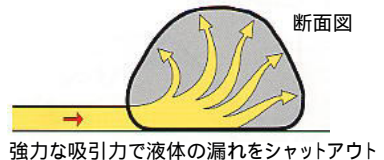
強力な吸引力で液体の漏れをシャットアウト